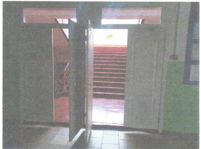
Φοτο Νο 18