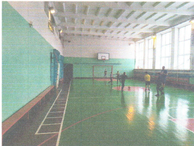
Φοτο Νο 8