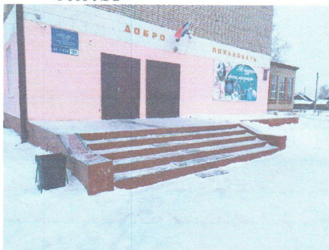
Фото № 2