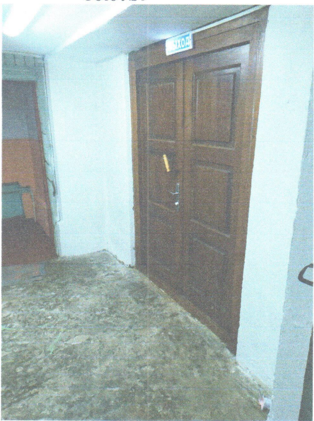
Φοτο Νο 9