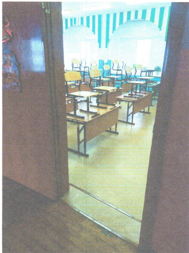
Φοτο Νο 12