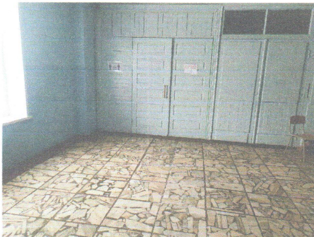
Φοτο Νο 7