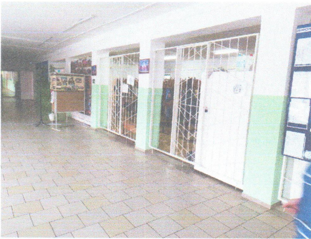
Φοτο Νο 17