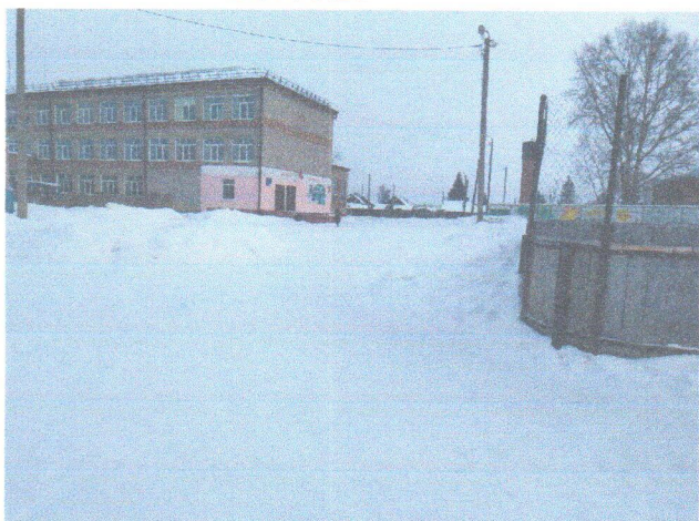
Фото № 3