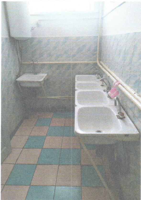
Φοτο Νο 13