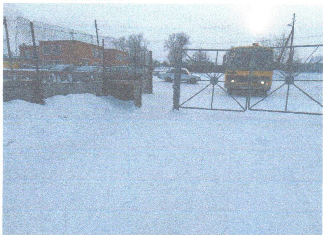
Фото № 4