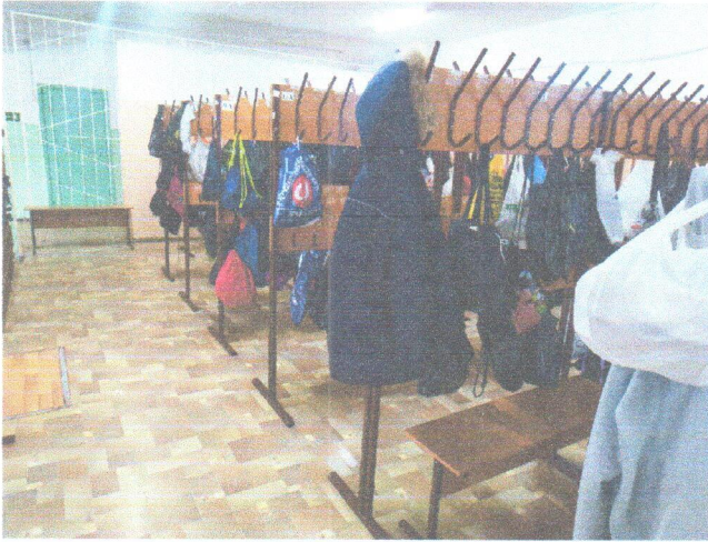
Φοτο Νο 15