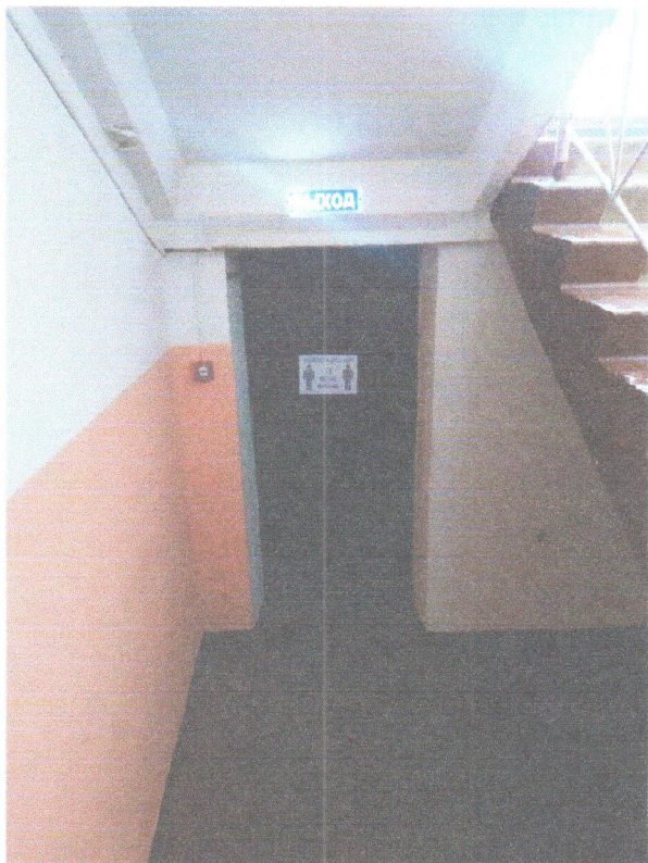
Φοτο Νο 11