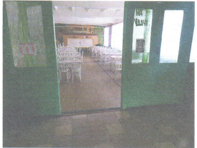
Φοτο Νο 16